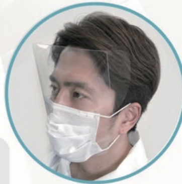
罫線A・Bを折った際の装着イメージ

Aの罫線を折ることにより曲面が若干、平らになります。 Bの罫線を折ることにより横からの飛沫をさらに守ることができます。 (折らなくても使用できます)