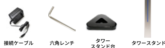
接続ケーブル 六角レンチ タワースタンド台 タワースタンド