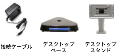
接続ケーブル デスクトップベース デスクトップスタンド