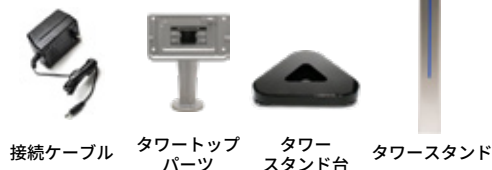
接続ケーブル タワートップパーツ タワースタンド台 タワースタンド