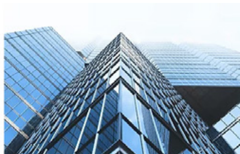
オフィスビルや 会社入口