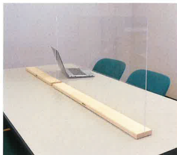
使用例 パーテーション60 + パーテーション90